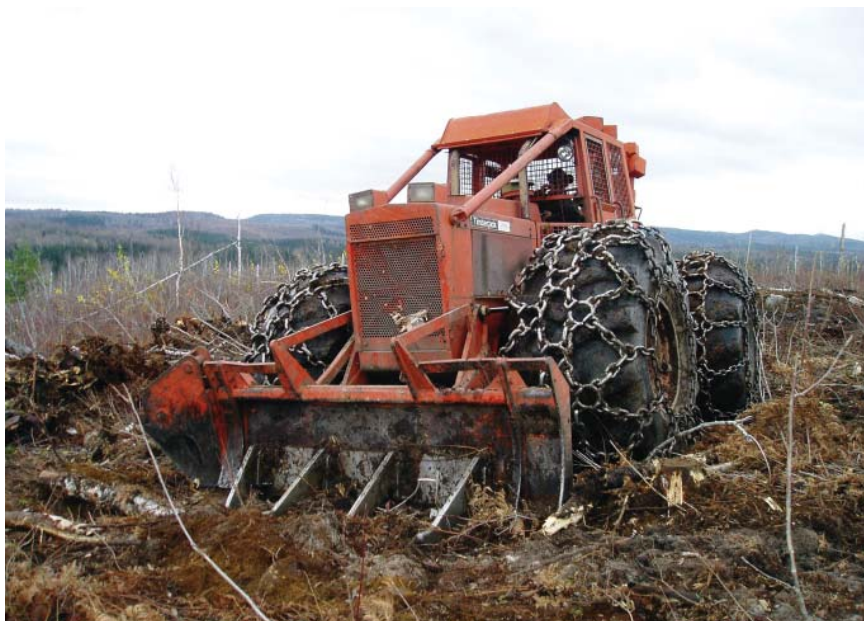
Figure 3 Peigne forestier monté sur une débusqueuse

La préparation de terrain par déblaiement permet d'abîmer et d'arracher en partie la végétation de compétition. Toutefois, un déblaiement trop sévère peut conduire à un « scalpage » du sol et à une diminution de sa fertilité ; l'opérateur devra donc minimiser les perturbations du sol (Dancause, 2008). Dans le cas d'un déblaiement trop sévère, une importante partie de la matière organique du parterre forestier pourra être exportée dans les