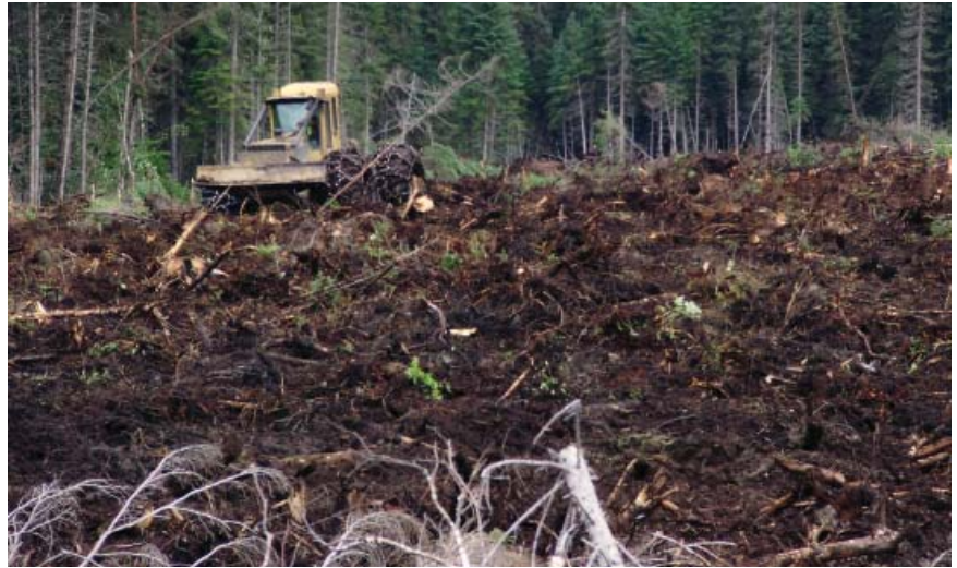
Figure 6 Parterre forestier préparé par 3 passages successifs de TTS hydraulique

le sommet du bourrelet. Plusieurs auteurs mentionnent également que la charnière constitue le meilleur choix de microsite (Örlander et al. , 1990; Sutherland et Foreman, 1995; Macadam et Kabzems, 2006).