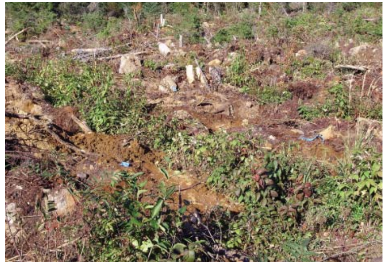
Figure 11 Microsites créés à partir de la méthode par inversion