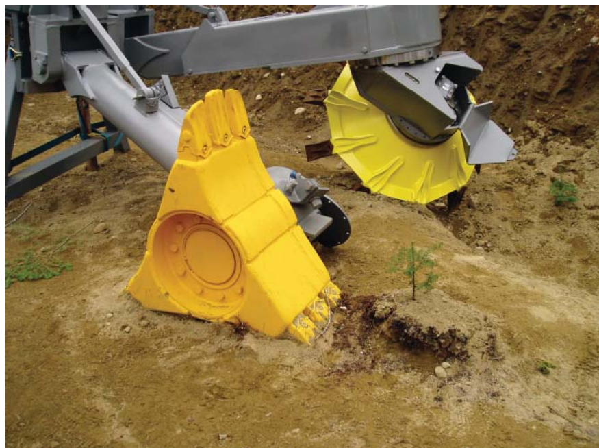
Figure 7 À gauche, le Bräcke Mounder et à droite, un disque de scarificateur TTS

sont créés à l'automne et que le reboisement est réalisé au printemps suivant, les monticules se seront compactés de façon naturelle. Sutton (1993) recommande effectivement de laisser passer un hiver avant d'effectuer la mise en terre des plants afin que le matériel se tasse et se stabilise.