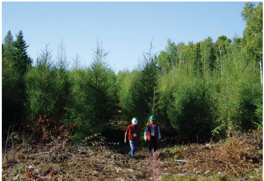
Figure 1 Plantation de mélèze hybride âgée de 7 ans

compétition, pourront être réduits de façon notable. Les bénéfices financiers d'une préparation de terrain intensive sont également influencés par la période de révolution de la plantation (Gan et al. , 1998 ; Hawkins et al. , 2006). Dans le cas des plantations de mélèzes à courtes révolutions, on peut envisager que le retour sur l'investissement sera plus rapide et que les bénéfices économiques pourront s'avérer plus importants.