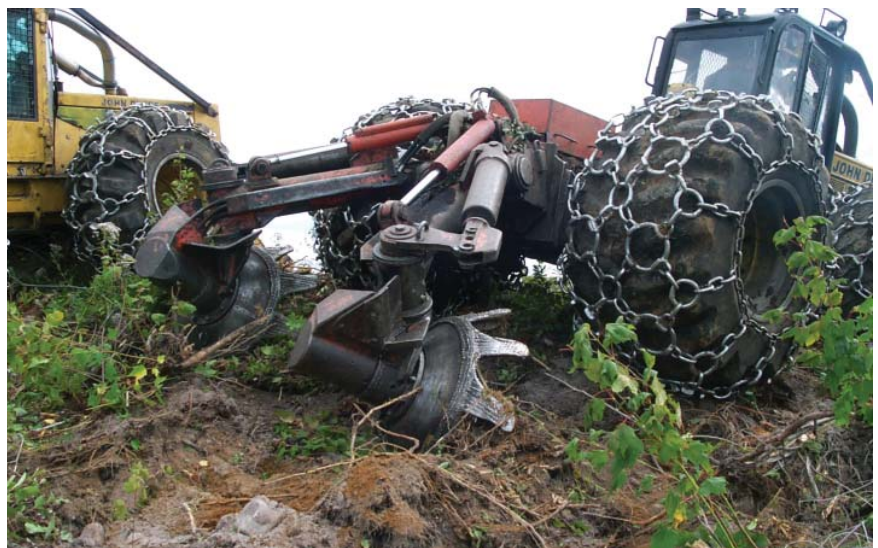
Figure 4 Scarificateur TTS hydraulique monté sur une débusqueuse

Plusieurs études rapportent les avantages du scarifiage par sillons pour la croissance et la survie de plants résineux (Tellier et al. ,