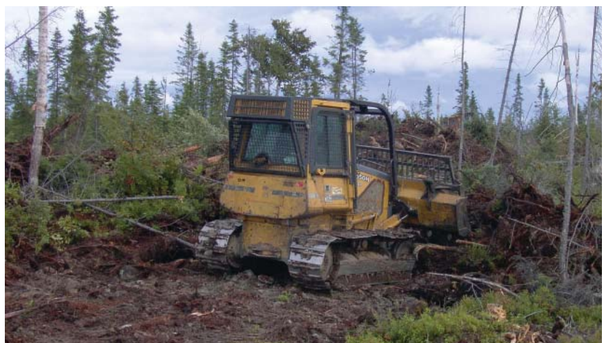
Figure 2 Déblaiement avec un peigne forestier monté sur un bouteur

surface (Coates et Haeussler, 1988). Une pelle en V montée sur un bouteur peut également réaliser le déblaiement tout en créant des sillons qui favoriseront le travail des planteurs (Carter et Selin, 1987). Ces auteurs rapportent que ce type d'appareil a produit de bons résultats pour l'établissement de plantations de mélèze hybride dans le nord-est des États-Unis.