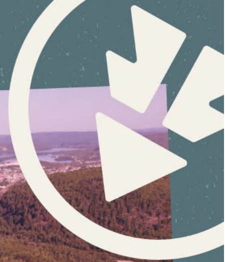
SCHÉMA DE COUVERTURE DE RISQUES EN SÉCURITÉ INCENDIE